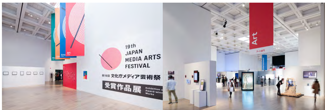
第19回文化庁メディア芸術祭 受賞作品展の様子

本展では、アート、エンターテインメント、アニメーション、マンガの4部門で世界88カ国・地域から寄せられた4,034作品の応募作品から選ばれた全受賞作品と功労賞受賞者の功績等を紹介します。厳正な審査で選ばれた今年度を代表するメディア芸術作品の数々と、国内外の多彩なクリエイターやアーティストが集う様々な関連イベントを通じて、メディア芸術の“時代(いま)”を映し出します。