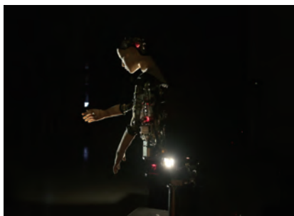
© 2016 Alter developed by Ishiguro Lab. in Osaka Univ. and Ikegami Lab. In Univ. Tokyo

大賞受賞者・オープニングトーク 日時：9月16日(土) 12:30-13:30 会場：NTT インターコミュニケーション・センター [ICC] 4F 特設会場