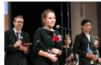
第18回文化庁メディア芸術祭 贈呈式の様子（2014年度）

大 賞：賞状、トロフィー、副賞 60 万円 優秀賞：賞状、トロフィー、副賞 30 万円 新人賞：賞状、トロフィー、副賞 20 万円 功労賞：賞状、トロフィー このほか、優れた作品を審査委員会推薦作品として選定します。