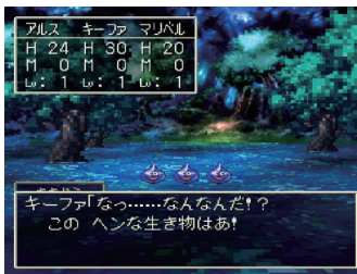
© 2000 ARMOR PROJECT/BIRD STUDIO/HEART BEAT/ARTEPIAZZA/ SQUARE ENIX All Rights Reserved.

第4回 デジタルアート(インタラクティブ)部門 大賞 ドラゴンクエストVII ～エデンの戦士たち～ ドラゴンクエストVII 開発チーム 代表 堀井 雄二 (シナリオ & ゲームデザイン) / すぎやま こういち (音楽) / 鳥山 明 (キャラクターデザイン) / 山名 学 (メインプログラム) / 眞島 真太郎 (アートディレクション)