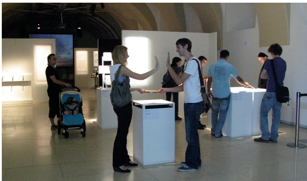
昨年度の展示風景

現代におけるメディア芸術においても、歴史や風土に根ざした特徴を見つけることができます。本展覧会は、日本の「ものづくり」と「ものがたり」をテーマにして、展示と上映を行います。「ものづくり」としては、テクノロジーと表現の融合から生み出される精緻なメディアアート作品を、「ものがたり」としては、想像力と表現力によって紡ぎだされたゲームやアニメーション、マンガの世界を紹介していきます。これらを通して日本のメディア芸術の魅力を発信し、日本文化への理解がより深まるよう、会期中にはシンポジウムやワークショップなども開催する予定です。