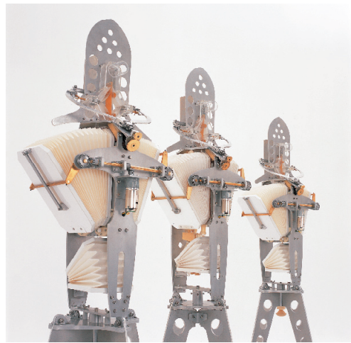
© Yoshimono Kogyo Co., Ltd. / Maywa Denki Photo by Jun Mitsuhashi