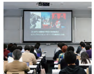
指導者向けセミナー