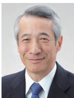
公益財団法人 画像情報教育振興協会 理事長

さまざまな分野で画像情報の役割がますます大きくなり、人材育成と文化振興の重要性が高まっています。当協会は公益法人に求められるガバナンス体制を維持し、二つの柱となる活動に邁進し、社会に貢献していきたいと考えています。