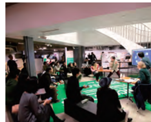
メディア芸術クリエイター育成支援事業成果発表

新しい文化を育む支援活動に取り組んでいます。「メディア芸術クリエイター育成支援事業」は、文化庁から委託され、文化庁メディア芸術祭の若手受賞者などの新企画に対して制作支援をしています。そして新しい分野のアーティストやクリエイターを、フェスティバル、ミュージアム、企業などとコーディネートすることや、新しい才能を世界につなげるWebサイト「DEPARTURE」を運営しています。