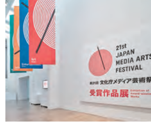
文化庁メディア芸術祭

デジタル技術が表現ツールとして広がり、日本のマンガやアニメなどへの世界的な評価が高まった90年代の状況を反映して誕生した「文化庁メディア芸術祭」も、2019年度で第23回となります。回を重ねるごとに認知度も高まり、国際的にも大きな祭典へと成長しています。長期展望や社会環境の変化をふまえて、新しいフェーズに着実に進んでいくことができる企画・運営を担っています。