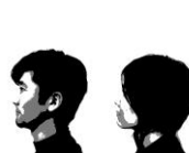
近森基十久納鏡子(plaplax)

・近森基十久納鏡子(plaplax) 《Tool's Life》シリーズ、クワクボリョウタ 《いち、に、たくさん》(GYREバージョン)、トーチカ 《Green Fairy》